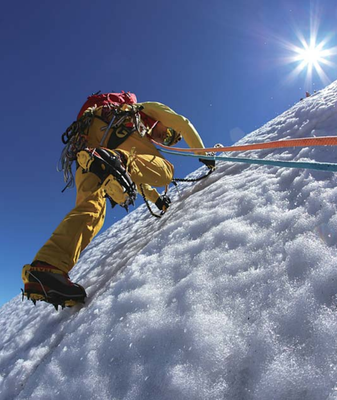
Location: Monte Bianco