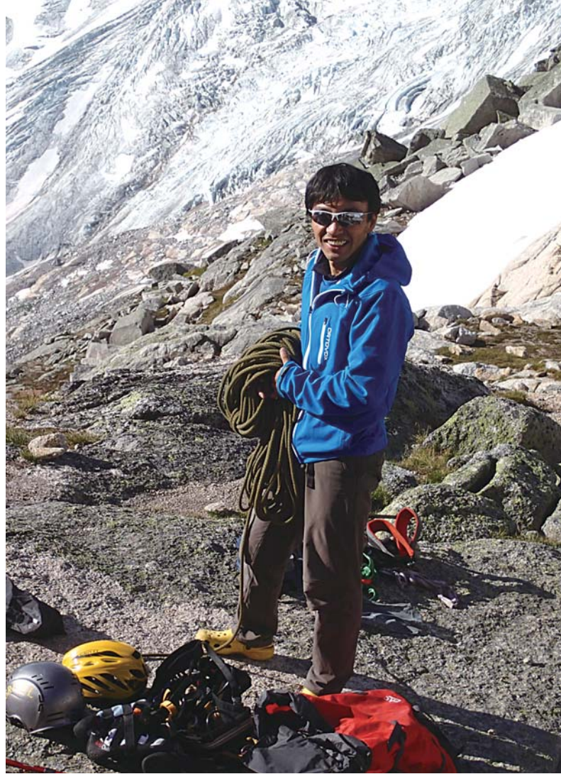
(カナダバガブー山群)