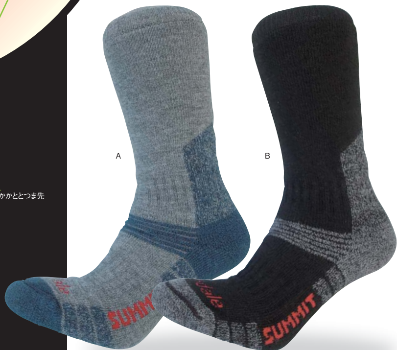
エンデュランスサミット