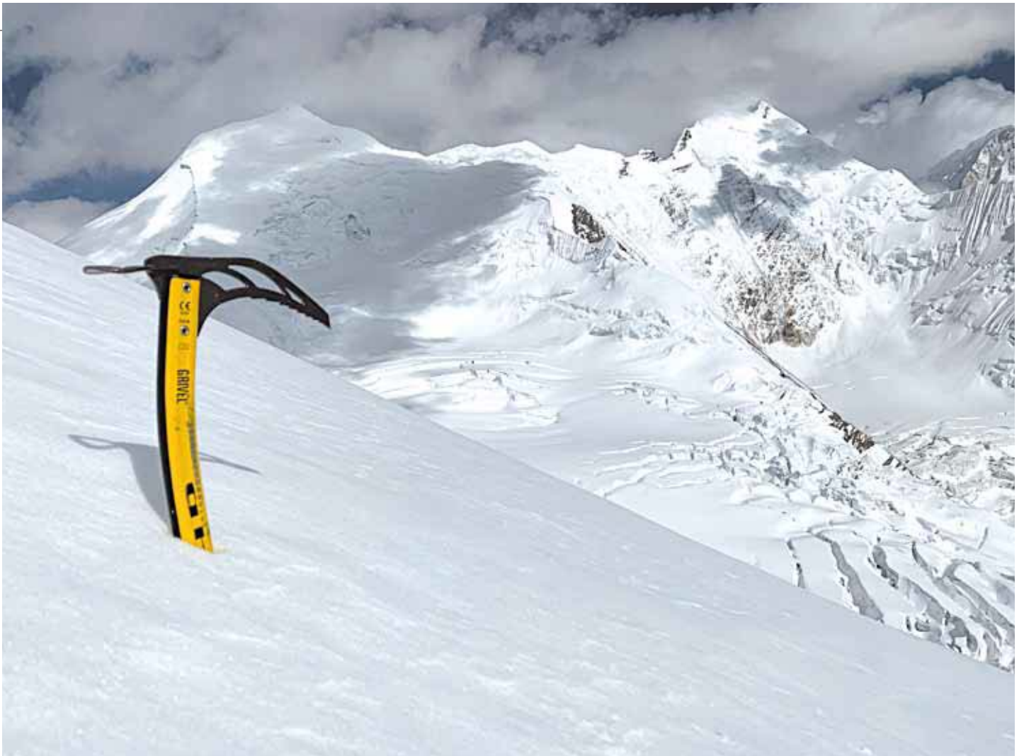
ネパールヒマラヤ ヒムルンヒマールとヒムジュン(右の山)