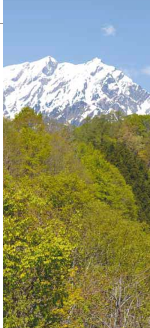
写真:春の爺ヶ岳 撮影地:小熊山