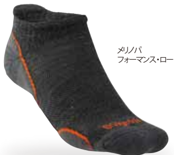
メリノパ フォーマンス・ロー