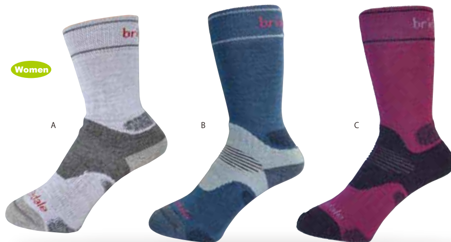
ウイメンズパフォーマンス・ハイク