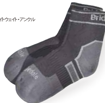
ライトウェイト・アンクル