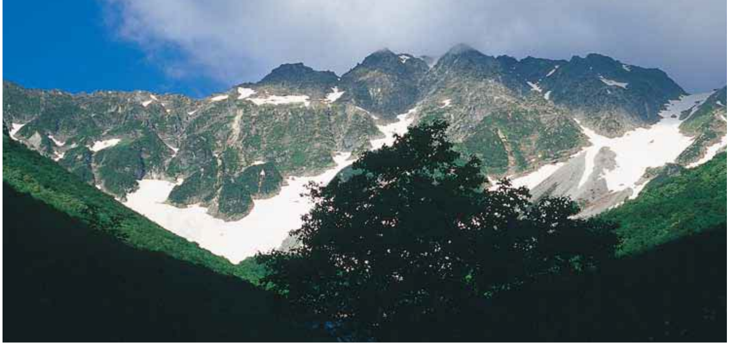
写真：穂高岳瀧沢園谷