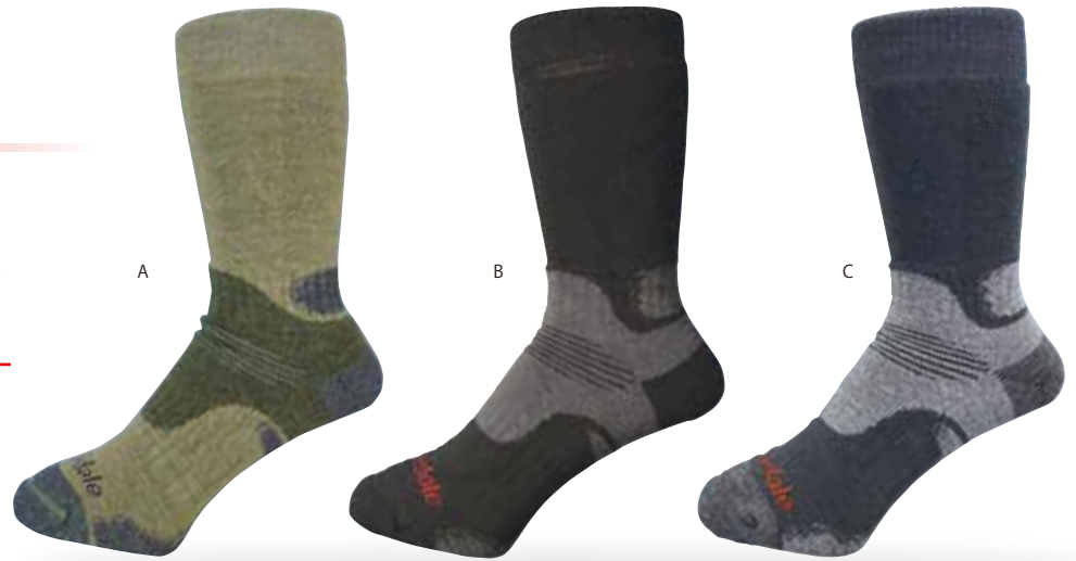
パフォーマンス・ハイク