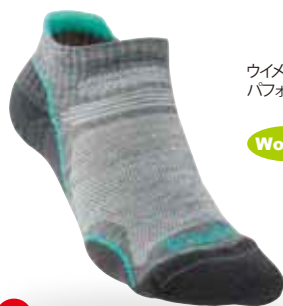
ウイメンズメリノ パフォーマンス・ロー