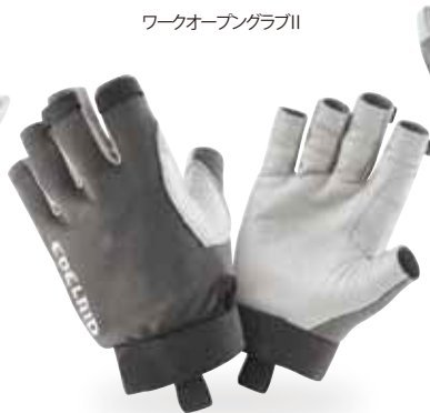
ワークオープングラブII

●素材/甲:ポリエステル、エラストン、パーム:カウハイド(牝牛の皮) ●サイズ/XS、S、M、L、XL ●カラー/チタン