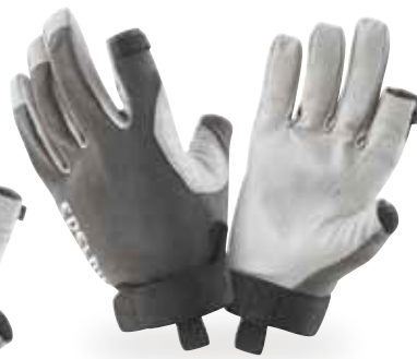
ワーククローズグラブII

●素材/甲:ポリエステル、エラストン、パーム:カウハイド(牝牛の皮) ●サイズ/XS、S、M、L ●カラー/チタン