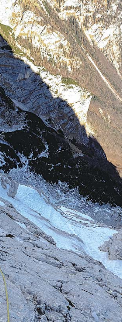
Climber: Steve House Location: Slovenia