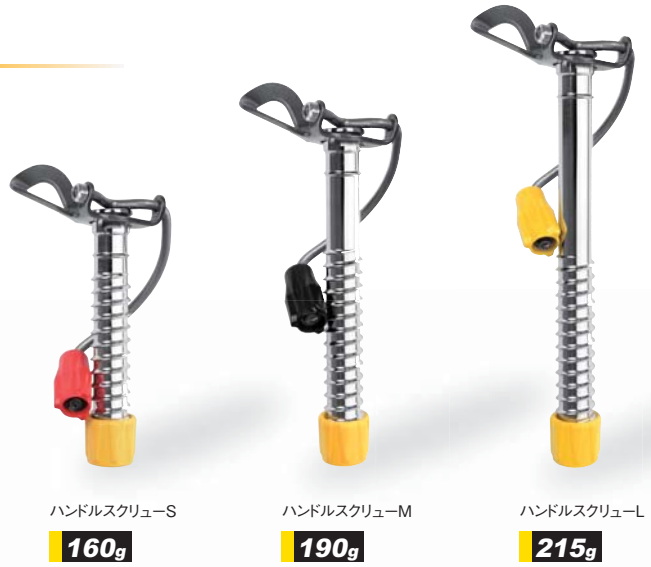
ハンドルスクリュース 160g

GV-IS251L ハンドルスクリュール(20cm) .....定¥8,000+税 ●重量/215g●ブラックホール付き