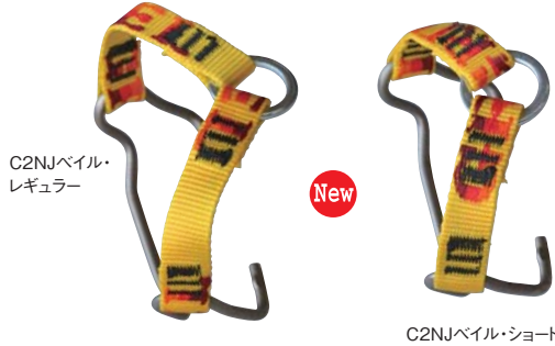
C2NJベイル・レギュラー