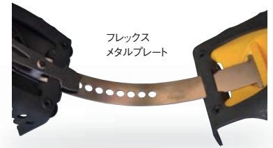
フレックスメタルプレート