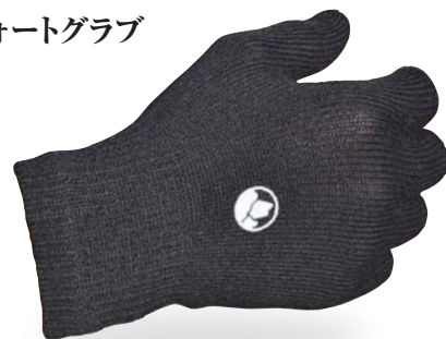
コーラ・ コンフォートグラブ