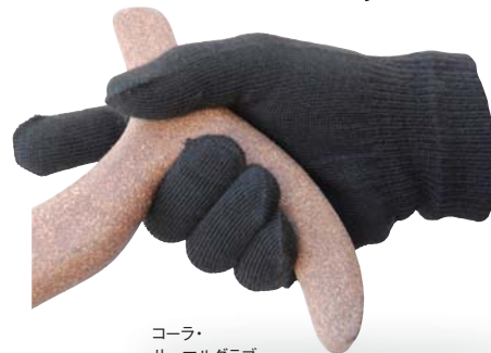
コーラ・ サーマルグラブ