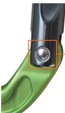
リベットを保護する小さなこだわり