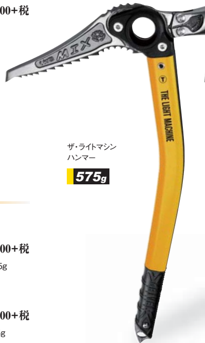
ザ・ライトマシンハンマー

GV-PIMACLIGS ザ・ライトマシン シャベル..... 定¥22,500+税 シャベルアッズ付き。専用ピック交換が出来る。●サイズ/シャフト長50cm●重量/565g