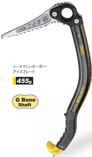
ノースマシンカーボン・アイスブレード

エクストリームラインは、グリベル製品の内、過激な「アルパインクライミング」や「ドライツリーング」のための製品カテゴリー。