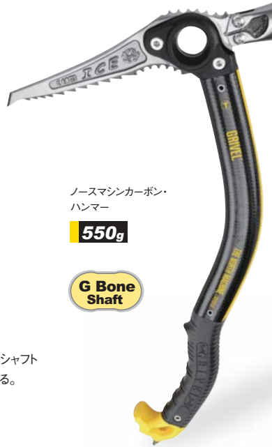
ノースマシンカーボン・ハンマー

先進的Gボーンシャフト カーボンコンポジットの骨形状シャフトは側面の溝が強度をより高める。