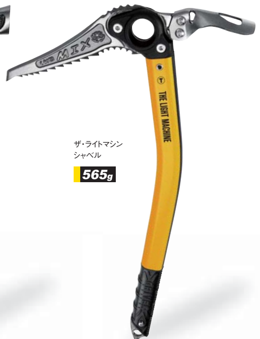
ザ・ライトマシンシャベル