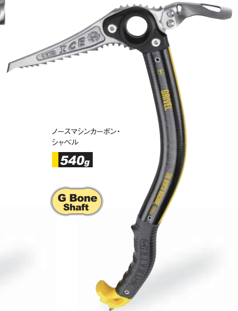
ノースマシンカーボン・シャベル