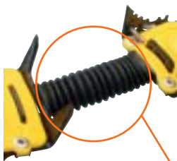
すべてのクランポンに付けられている アコーディオンアンチポット

重量 / 335g(片方) つま先はハーネス式、かかとはバインディング止め。ジョイントは固いメタルプレート付き。