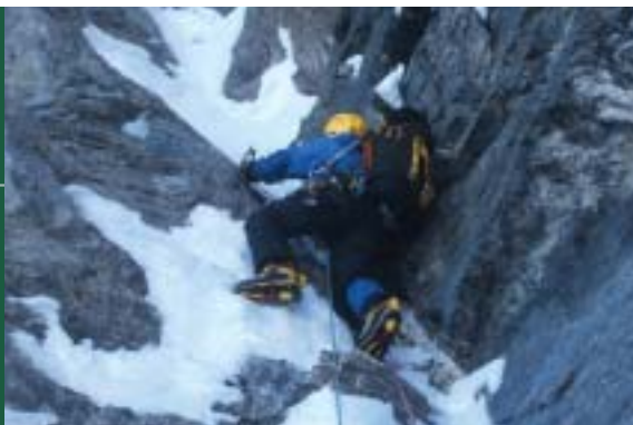
アイガー北壁核心部を登る クリストフ・プロフィー(2007年4月)