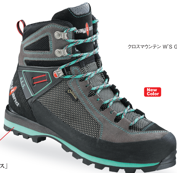
クロスマウンテン W'S GTX