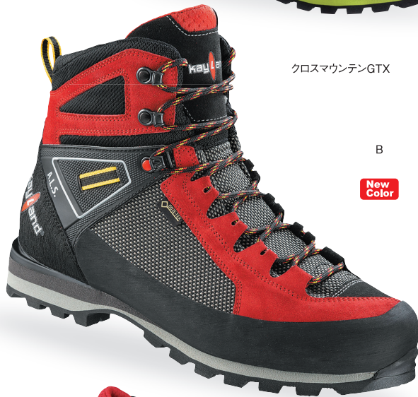
クロスマウンテンGTX