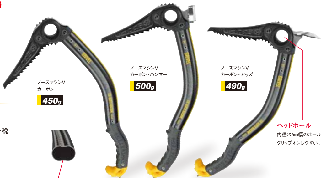
ノースマシンV カーボン 450g