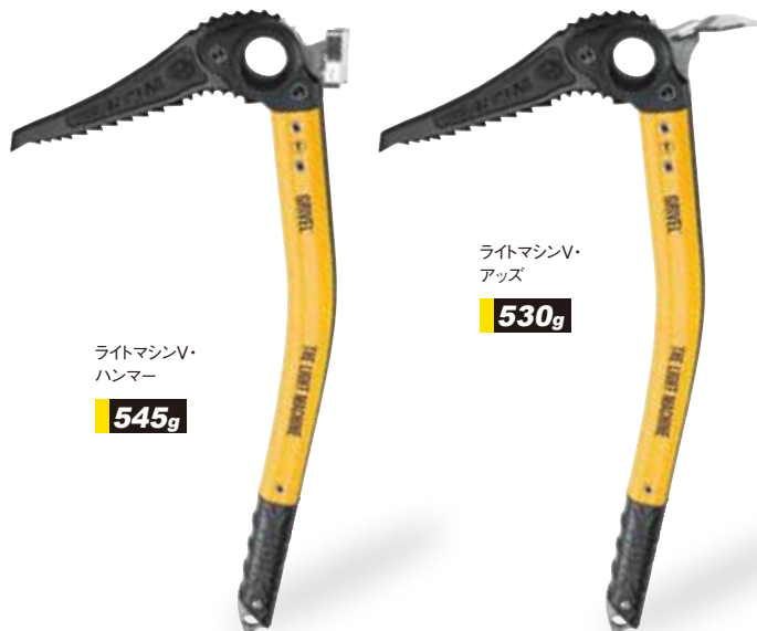
ライトマシンV・ ハンマー 545g