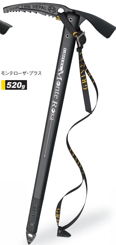
モンテローザ・プラス