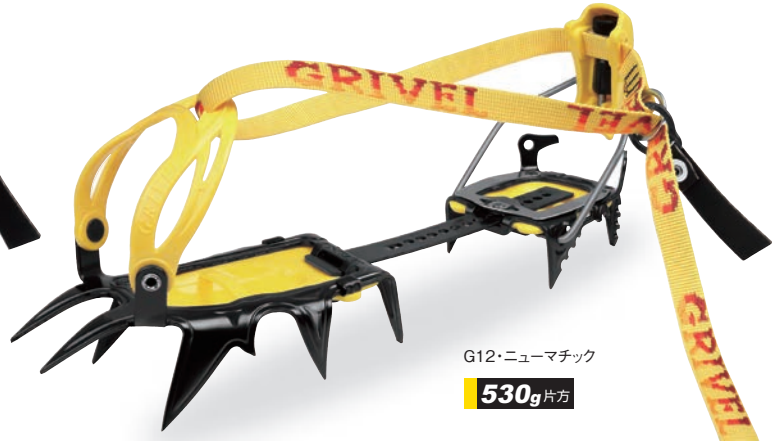
G12・ニューマチック