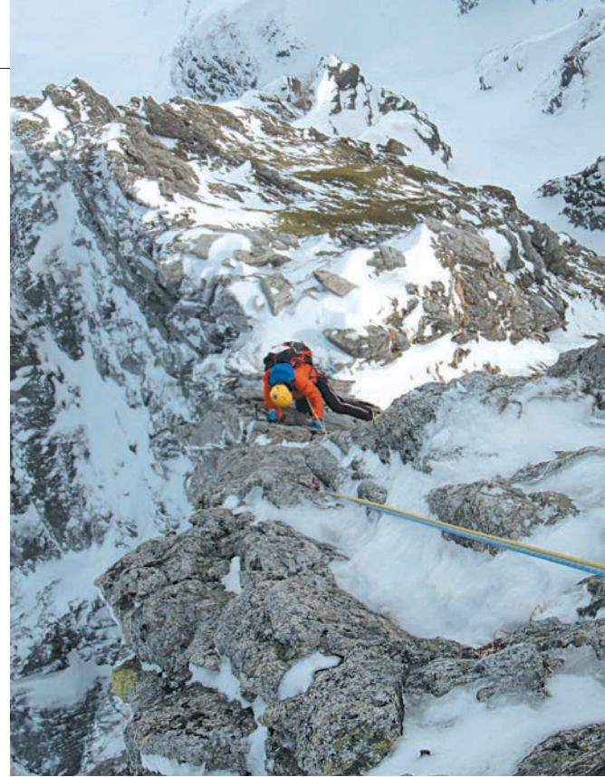
クライマー:黒田誠 場所:剣岳チンネ左稜線(2019年3月)