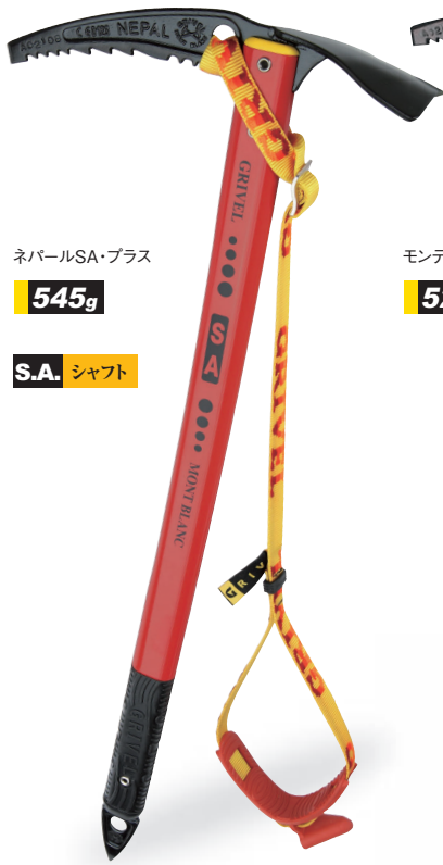
ネパールSA・プラス