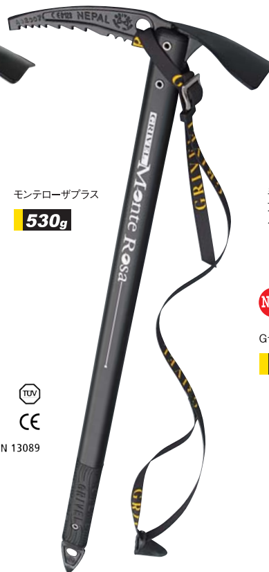
モンテローザプラス