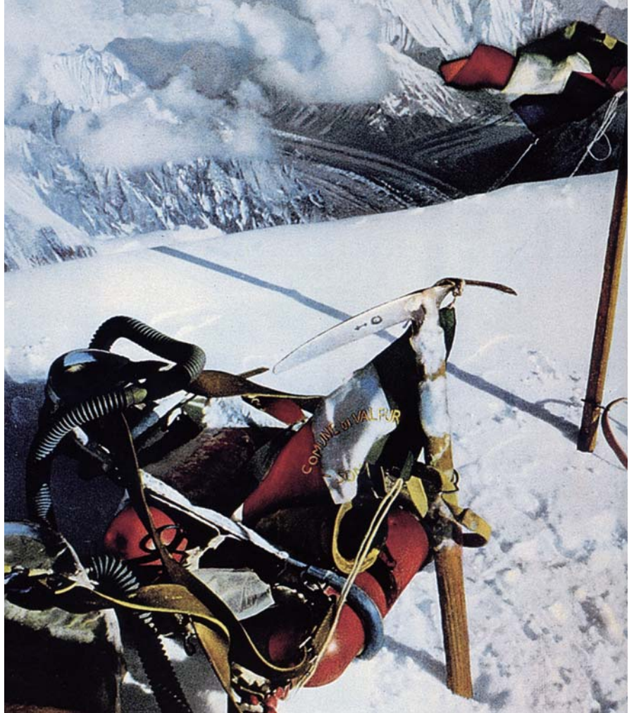
1954年7月31日 K2頂上 (8,611m) イタリア隊初登頂

●サイズ/シャフト長58、66、74 (cm) ●重量/465g (58cmリッシュ付き)