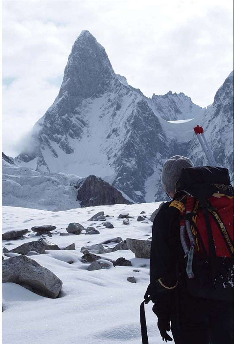
写真：タ・フルータムへ向かう山野井泰史(カラコルム・ヒスパー氷河)